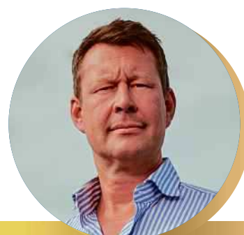
P18 | OREEL GROEP