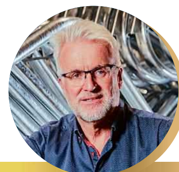
P22 | SPINDER DAIRY HOUSING CONCEPTS

REGISTREER JE GRATIS VOOR DE ONLINE FINALE OP WWW.VFO.NL