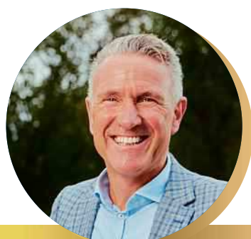
P8 | FRIESLAND LEASE