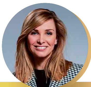
P15 | ONLINE FINALE