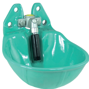
Suevia model 25R