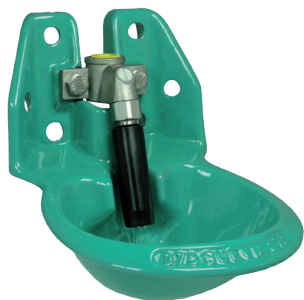
Suevia model 375