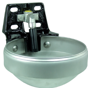
Suevia model 1200