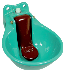
Suevia model 115