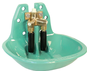
Suevia model 19R