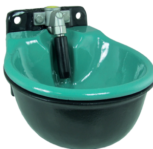
Suevia model 46