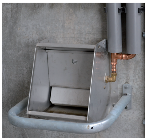
• Roestvrijstalen drinkbak model 500 plus beschermbeugel