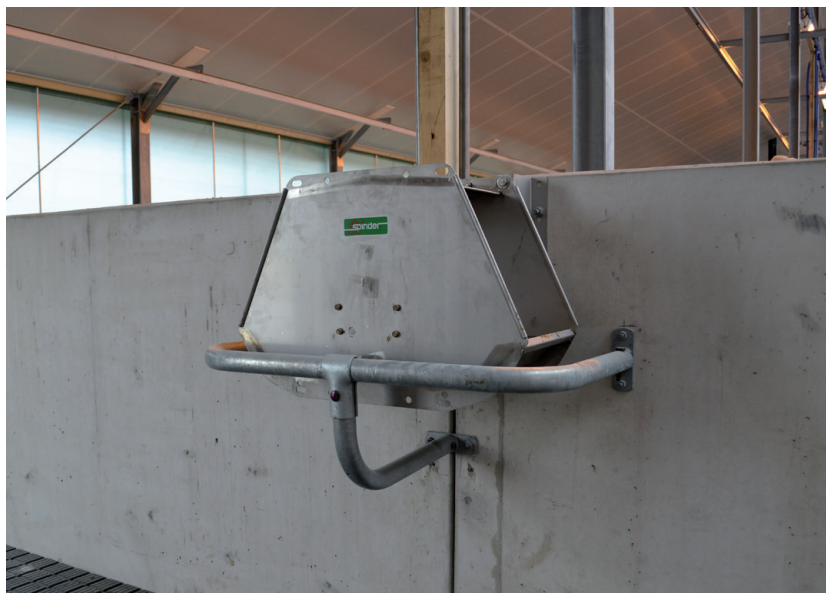
• Roestvrijstalen duo-drinkbak model 520