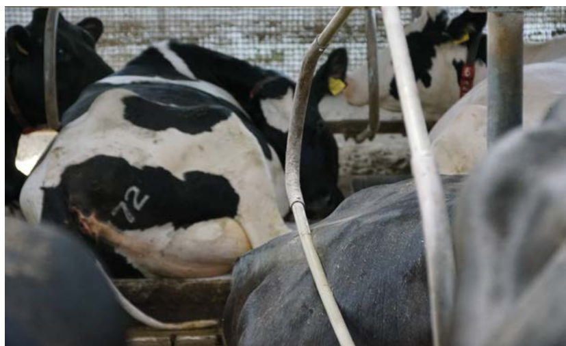
De 'Fitbox' veert mee met de beweging van de koe.